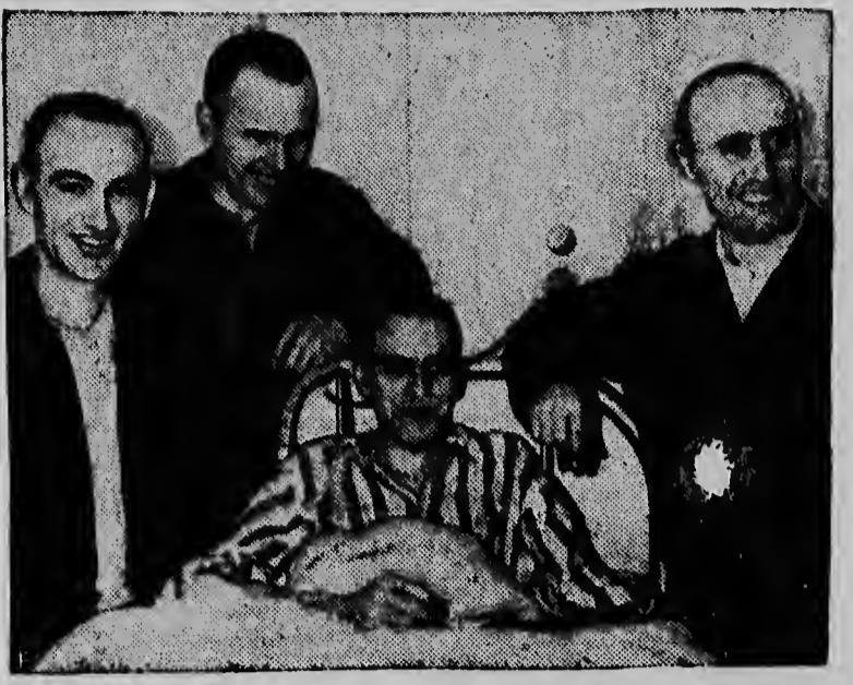
Deze Ierse priesters, die onlangs uit communistische gevangenschap in China werden vrijgelaten en over de grens gezet, hebben alle reden te glimlachen. Zij behoren tot de missie-vereniging van St. Columban en brachten vele jaren in de gevangenis door. Allen leden aan ondervoeding.

Dit memorandum werd aan de aanwezige journalisten verstrekt op de persconferentie van het Bestuurscollege d.d. 13 Januari 1954.